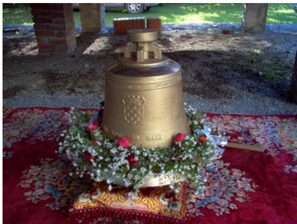
Slika br. 1. Zvono župne crkve Kraljice svete Krunice; (Opis: Težina: 96. kg; Natpis: U spomen poginulim braniteljima; Posvećeno: blaženom Alojziju Stepincu; Glas: G -dur) postavljeno i blagoslovljeno 28. 09. 2005. godine.

Znamo da svagdje u ovom svijetu postoje duše koje osjećaju potrebu za svetim mjestom na kojem će upoznavati sebe, razloge svojeg postojanja, u kojem će prebroditi sve teškoće na putu života. Velika je sreća živjeti u mjestu sa zvonikom u kojem se čuje zvuk zvona koje nas zove na susret s Vječnim ( vidi: sl. br. 1. ). S našom župom je izražena duša nas župljana, naše potrebe za duhovnim i tradicijom stoljetne vjere. Stoga neka nas zvono na zvoniku ispred naše crkve podsjeća da ne zaboravimo ono što smo baštinili od svojih predaka, a to je vjera u Boga. Neka ova naša prva župna crkva jednog dana ne ostane u zaboravu, već u trajnom sjećanju svim župljanima kao duboki, čvrsti temelj svih sadašnjih i budućih župljana.