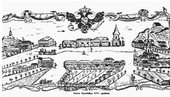
Slika br. 3. «Fridrichovo selo»

Stara Gradiška), ali zbog čestih poplava, zaraznih bolesti - kuge, osniva se novo sjedište pukovnije na području u vlasništvu generala baruna Engelshofena. Na tom zemljištu bila su samo polja i usjevi. U početku se novo sjedište pukovnije zvalo Fridrichovo selo, po kraljevskom savjetniku i zapovjedniku pukovnije Fridrichu W. Taubeu, ali on osobno