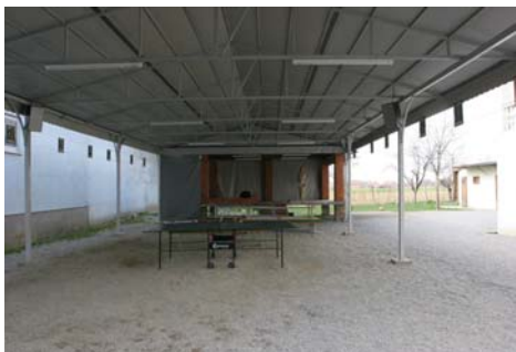
Slika br. 13. «Crkva Duha i propuha»- Zbog velikog broja vjernika 1995. godine je izgrađena povišena bina, namijenjena bogoslužju, a 2005. godine je natkriveno dvorište u dužini bine.

Crkva i glavni ulaz su orijentirani postranično prema glavnoj ulici. Ulaskom u dvorište crkve ulazi se u prostor tzv. »Duha i propuha« u kojem se nalazi natkriveni uzvišeni dio za bogoslužje. Zbog velikog broja vjernika tim prostorom se služi u toplija vremena i on je polivalentan. Bočno od bine nalaze se tri ulaza u crkvu ( vidi sl. br. 13. ).