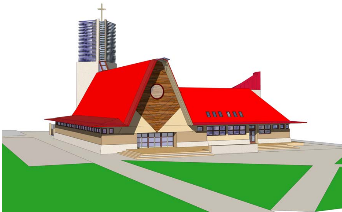
Slika br. 24. Nacrt nove crkve; Nacrt je izradila arhitektica Danijela Morsan Sisgoreo, a «ABP» vlasnice Mande Biondić je središnje mjesto projektne dokumentacije daljnje izgradnje crkve.

prostor sjedišta. Dok se razmišljalo gdje bi moglo biti novo sjedište, gosp. Ivica Jurenac je poklonio zemljište za novu crkvu (z. k. ul. 559 k. o. Nova Gradiška i to: k. č. 3409 oranica u Brestovima sa 48 a i 12 m 2 , 28. svibnja 1996.godine) za dvije zakladne mise, na Uskrs i na sam god, da se služe za pokojne roditelje. Nakon što je nova crkva dobila sjedište bilo je potrebno izraditi plan razvoja grada za južni dio, ostvariti urbanističke uvjete, izraditi projekt nove crkve ( vidi: sl. br.24. ).