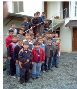
Slika br. 23. Ministranti Ljupina i Jug

Uloga ministrantske zajednice jest da dublje ulazi u narav poruku bogoslužja. Okupljaju se jednom tjedno. Ukupno ministranata u župi ima 31.