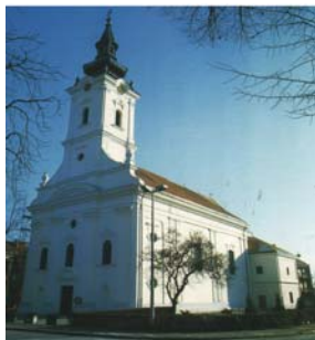
Slika br. 6. Župna crkva Bezgrešnog začeca Blažene Djevice Marije u Novoj Gradiški

Nova Gradiška se počela naglo razvijati, naseljavali su se obrtnici i trgovci, broj stanovnika se povećava te crkva sv. Terezije Avilske postaje premalena za toliki broj vjernika. Za vrijeme biskupovanja Maksimilijana Vrhovca, 1811. godine započinje gradnja nove župne crkve. Zbog Napoleonskih ratova, gospodarske krize i siromaštva gradnja je tekla vrlo sporo. Građena je u baroknom stilu, a njezine su zidove oslikavali poznati hrvatski slikari Josip