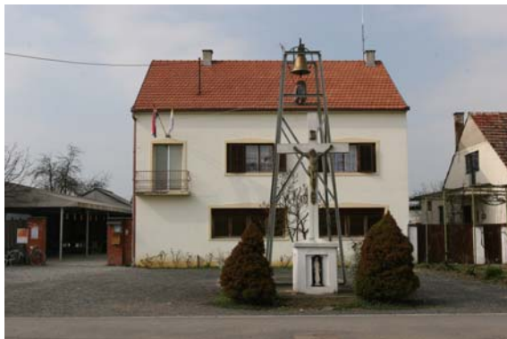
Slika br. 12. Župna crkva, župni stan i župni ured