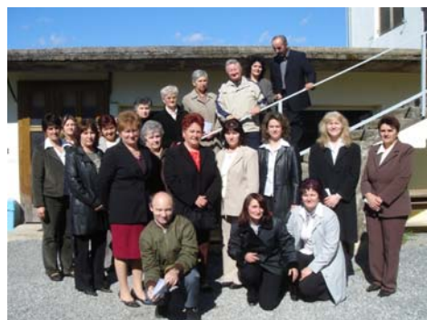
Slika br. 20. Veliki zbor