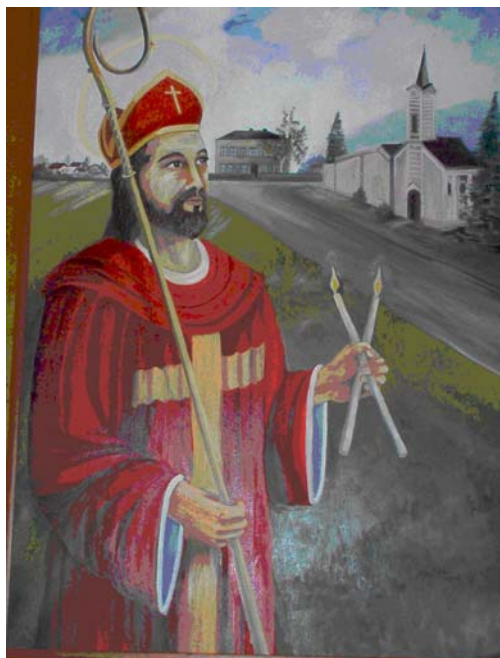
Slika br. 26. sv. Blaž

kako bi ga prisilili na otpad. Sveti biskup hrabro je podnio sve muke i nije se dao ni s čim zastrašiti. Krvnik mu je godine 317. odрубio glavu. Ta glava kao dragocjena relikvija godine 972. dospjela je u Dubrovnik. Grad ga je izabrao za svog zaštitnika i već 1000 godina stoji pod njegovom zaštitom. Kao što čuva Dubrovnik, tako čuva i našu Ljupinu. (vidi: sl. br. 26.)